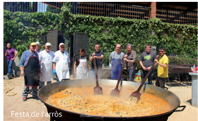
Festa de l'arròs