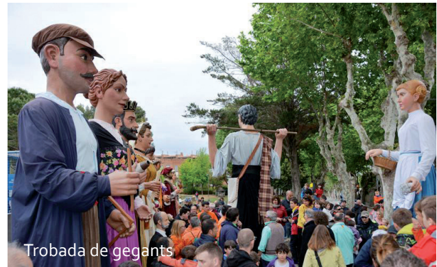
Trobada de gegants